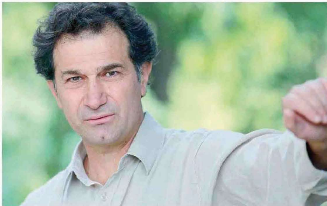
Arte a cielo aperto Regista, attore teatrale, di serie tv e film