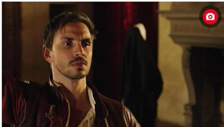
Correggio, un'immagine del corto L'ultima Notte