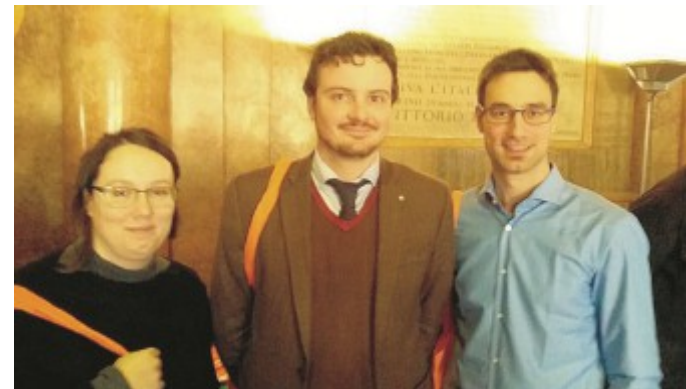
Progetto Tre dei parmigiani premiati. In alto, foto di gruppo a Bologna.

Il progetto «Patrimonio culturale e turismo esperienziale» coniuga ricerca storico-archeologica e sviluppo sul territorio per